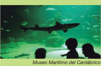
Museo Marítimo del Cantábrico