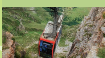
Teleférico de Fuente Dé

Parque de Matalaños Parque público junto al mar con algunas de las mejores vistas de la ciudad y una gran zona de juegos. Dirección: Avda. del faro, s/n. Santander. Horario: de 9 a 18 horas; verano de 9 a 21.