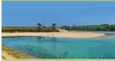
Parque Natural de Collados del Asón

Playas, dunas, acantilados, praderas costeras, rías... Este espacio volcado al Atlántico es como un compendio de todas las posibles formas que puede adoptar la costa en Cantabria.