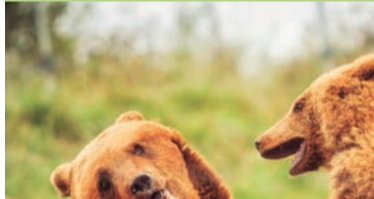
Parque de la Naturaleza de Cabárceno

Explica la fauna y flora, entre otros aspectos del Monte Hijo, masa forestal más importante de Cantabria y segunda de España. Paneles, maquetas y audiovisuales, módulos interactivos, y reproducciones. Tel. 648 191 761 - www.medioambientecantabria.com