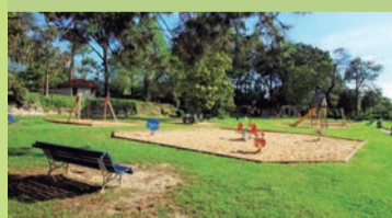
Parque de Matalaños

Parque de la Magdalena Bellísimo parque público alrededor del palacio de verano del rey Alfonso XIII. Tiene un pequeño zoo, un tren turístico y una gran zona de juegos junto a la playa. Dirección: Avda. de La Magdalena, s/n. Horario: De junio a septiembre, de 8 a 22 horas; de octubre a mayo, de 8 a 20:30 horas.