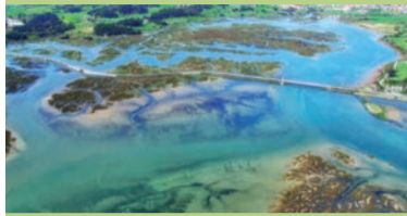
Parque Natural de las Marismas de Santoña, Victoria y Joyel

El Parque Nacional de los Picos de Europa es uno de los conjuntos montañosos más espectaculares de la Península Ibérica. Este impresionante macizo de piedra, con altitudes que alcanzan más de 2.500 metros sobre el nivel del mar, es visible prácticamente desde cualquier punto de Cantabria, y fácilmente accesible desde la comarca de Liébana, especialmente a través del Teleférico de Fuente Dé.