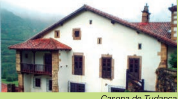
Casona de Tudanca