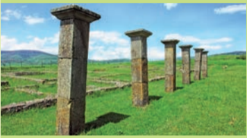
Centro de Interpretación de Julióbriga