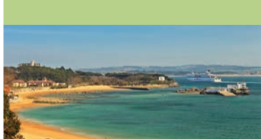
Bahía de Santander

Un recorrido por el parque permite recuperar las tradiciones, personajes y artefactos, que hubo en el pasado en el municipio de Arnuero. Cuenta con centros de interpretación visitables durante todo el año. www.ecoparque-trasmiera.com