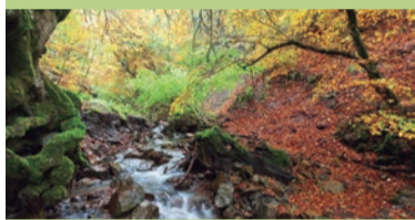
Parque Natural de Besaya

Las fuentes del río Asón, en el Valle de Soba y en torno a la Sierra del Hornijo, son una de las zonas más hermosas de Cantabria. Conserva virgen su naturaleza y costumbres de marcado carácter rural, con un paisaje dominado por bosques y riscos en los que la roca caliza se muestra en formaciones espectaculares y abruptas.