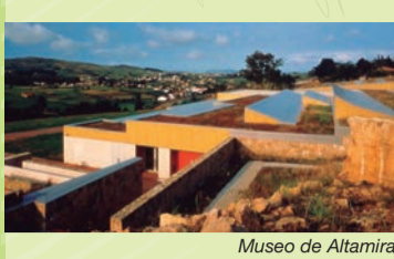
Museo de Altamira