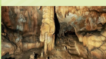
Hornos de la Peña