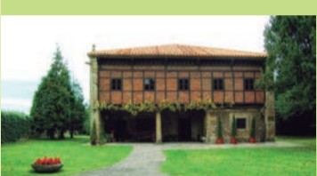
Museo Etnográfico de Cantabria