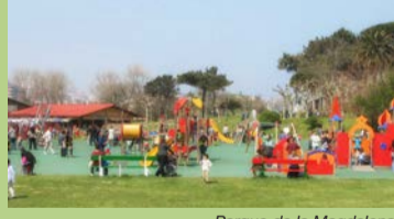
Parque de la Magdalena

Parque de la Magdalena Bellísimo parque público alrededor del palacio de verano del rey Alfonso XIII. Tiene un pequeño zoo, un tren turístico y una gran zona de juegos junto a la playa. Dirección: Avda. de La Magdalena, s/n. Horario: De junio a septiembre, de 8 a 22 horas; de octubre a mayo, de 8 a 20:30 horas.