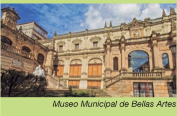
Museo Municipal de Bellas Artes