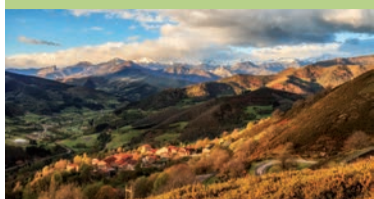
Parque Nacional de Picos de Europa

La omnipresencia de la naturaleza es una de las características más destacadas de Cantabria. Afortunadamente, la región cuenta con abundantes parques que se conservan prácticamente intactos. De entre ellos es imprescindible destacar los espacios naturales que se encuentran bajo alguna figura de protección.